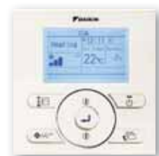
BRC073 en option.